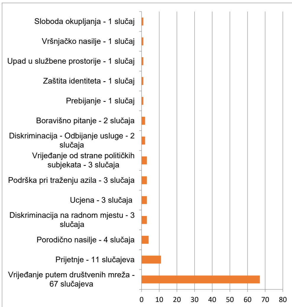
Grafikon 1: Pregled slučajeva po tipu

Ukupno 103 slučaja su obrađena ovom publikacijom, a na grafikonu iznad prikazan je pregled arhiviranih slučajeva po osnovu tipa. Kao što je jasno prikazano u grafikonu, najzastupljeniji broj prijavi podnije je povodom vrijeđanja LGBTIQ zajednice putem društvenih mreža, ukupno 67 prijavi. Sledeći najzastupljeniji tip registrovanih i obrađenih slučajeva jesu prijetnje upućene LGBTIQ zajednici, ukupno 11 slučajeva, praćeni slučajevima porodičnog nasilja, gdje je registrovano ukupno 4 slučaja u posmatranom periodu. Zatim, po 3 slučaja registrovana su u sljedećim tipovima: diskriminacija na radnom